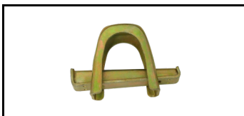
Keilkupplung 18SFS216 5189340