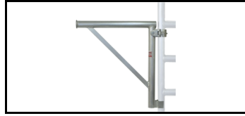
Konsole 1520060 5929687