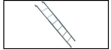
Gerüstleiter 1550212 5929691