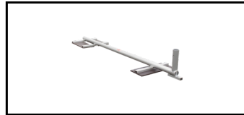
JUMBO-Safe Trittbrett 38JS103