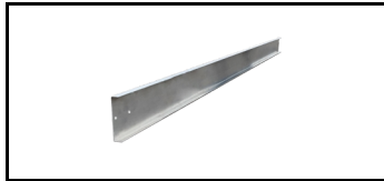
JUMBO-Safe Sockelleisten 38JS102