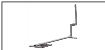
JUMBO-Safe Break Fußplan 38JS108K