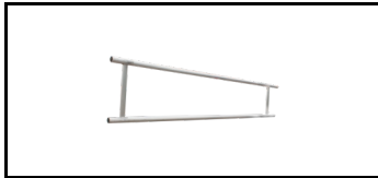
JUMBO-Safe-Zaun 38JS101 5350020