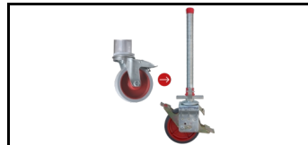
Ersetzen von Fahrrollen 1400204 7782766