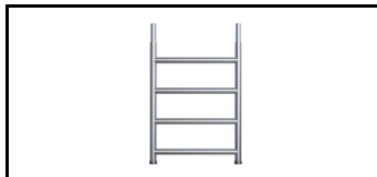
Rahmen 1 m 12074100 7782816