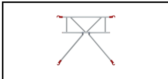
Handlauf mit Diagonalen AGR 1101780-AGR 2335718