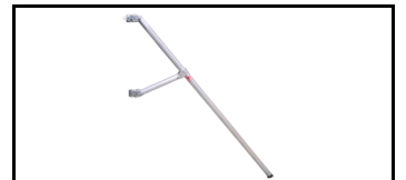
Stützbeine 1410250 7782758