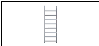
Rahmen 2 m 12074200 7782808