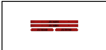
Kompletter Bausatz für Sockelleisten 1620178s 5741563