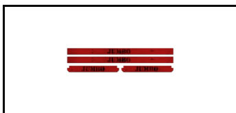
Kompletter Bausatz für Sockelleisten 1620305s 5741565