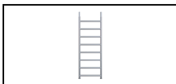
Rahmen 2 m 12074200 7782808