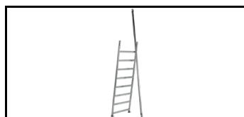
Erweiterungssatz für Rollgerüst s-1305 5929675