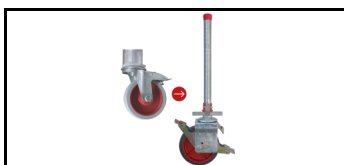
Ersetzen von Fahrrollen 1400204 7782766