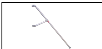
Stützbeine 1410250 7782758