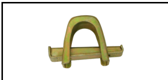
Keilkupplung 18SFS216 5189340