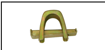
Keilkupplung 18SFS216 5189340