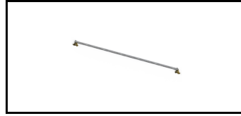
Diagonale 26GS1041 5033753