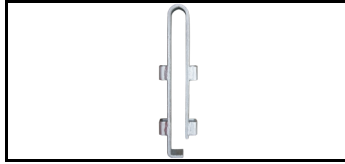
Beam Rider 26GS1033 5033765