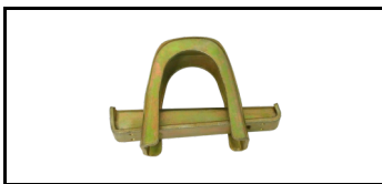
Keilkupplung 18SFS216 5189340