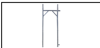
Rahmen der Fassade 2 m 12079200s 1252848