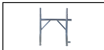
Fassade Rahmen 75 cm 12079075s 1252850