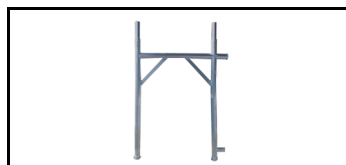
Rahmen der Fassade 1 m 12079100s 1252849