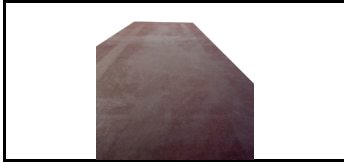
Furnier für Plattform ohne Luke 7501780