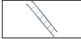
Gerüstleiter 1550212 5929691