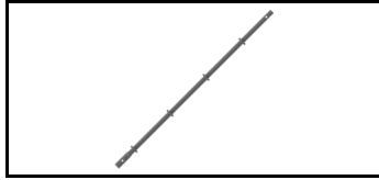
Combiflex-Säule 21JCF200S 1608388