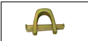
Keilkupplung 18SFS216 5189340