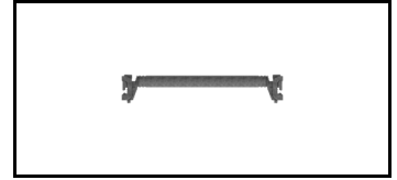
Combiflex Horizontal 21JCF70H 1608395