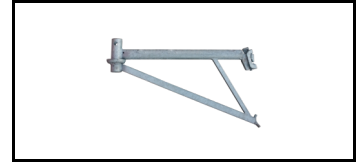
Combiflex-Halterung 21JCF70KH 1616373