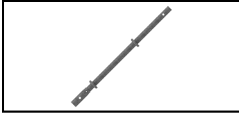
Combiflex-Säule 21JCF100S 1608363