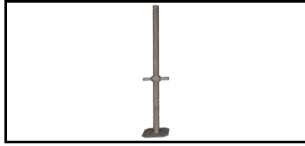
Combiflex-Fußplatte 21JCF740F 1675053