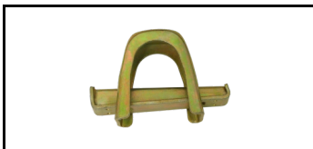
Keilkupplung 18SFS216 5189340