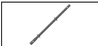
Combiflex-Säule 21JCF100S 1608363