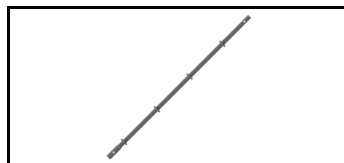
Combiflex-Säule 21JCF200S 1608388