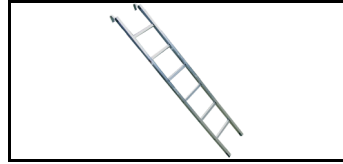
Gerüstleiter 1550212 5929691