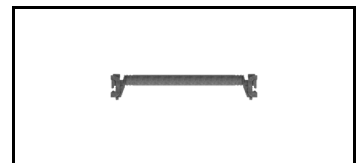
Combiflex Horizontal 21JCF70H 1608395