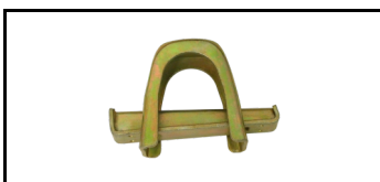
Keilkupplung 18SFS216 5189340