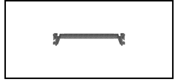
Combiflex Horizontal 21JCF70H 1608395