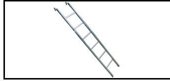
Gerüstleiter 1550212 5929691