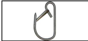
Hebehaken 38GEDA1408 1386840