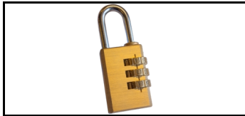
Vorhängeschloss ALU-H 1735333