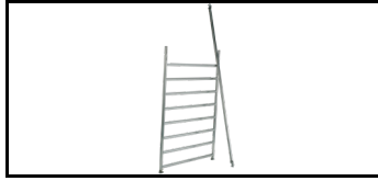
Erweiterungssatz für breites Rollgerüst b-1 7782709