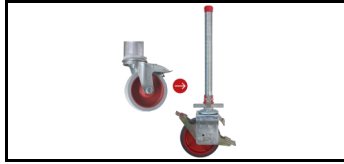
Ersetzen von Fahrrollen 1400204 7782766