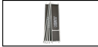
Plattform-Bausatz 102501BK 7782725