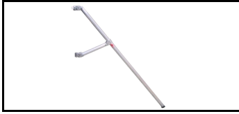
Stützbeine 1410150 7782741