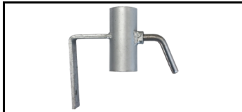
Halterung für den Fußtritt