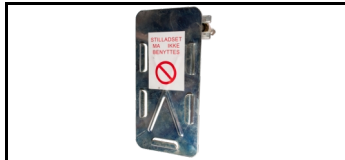
Scaftag-Halter 15SHSK 1678716