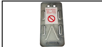
Scaftag-Halter 15SHS 1678715