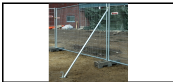
Stützbeine 35BH103 1849514