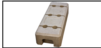
Betonblock 35BH100 5640182