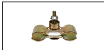
Bauzaun Spezialkupplung 35BH111 1963732