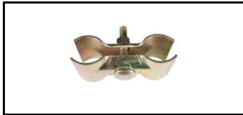
Sicherheitskupplung 35BH102 5741579