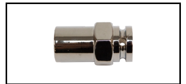
Schlüssel t/Spezialkupplung 35BH112 1963733