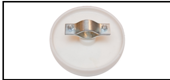
Räder 35BH013 1528853