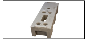
Gummiblock 35BH101 5640183