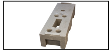
Gummi block 35BH101 5640183