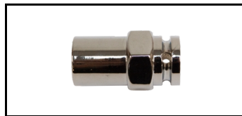
Schlüssel t/Spezialkupplung 35BH112 1963733