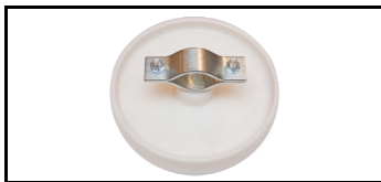
Räder 35BH013 1528853