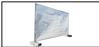
Netz 35BH108 2392260