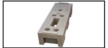
Gummiblock 35BH101 5640183