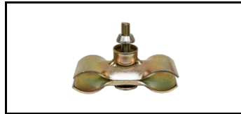
Bauzaun Spezialkupplung 35BH111 1963732