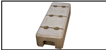
Betonblock 35BH100 5640182