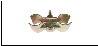
Sicherheitskupplung 35BH102 5741579