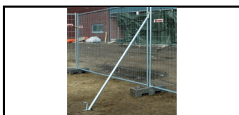
Stützbeine 35BH103 1849514