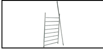
Erweiterungssatz für breites Rollgerüst