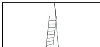
Erweiterungssatz für Rollgerüst s-1178 5929674