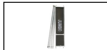
Plattform-Bausatz 101781sk 5929707