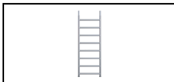
Rahmen 2 m 12074200 7782808