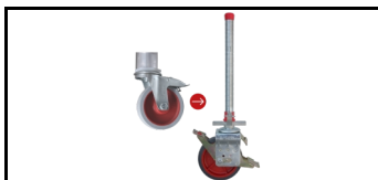
Ersetzen von Fahrrollen 1400204 7782766