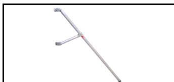
Stützbeine 1410150 7782741