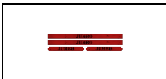
Kompletter Bausatz für Sockelleisten 1620178s 5741563