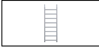
Rahmen 2 m