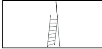
Erweiterungssatz für Rollgerüst