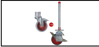
Ersetzen von Fahrrollen