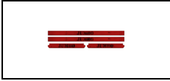
Kompletter Bausatz für Sockelleisten