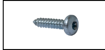
Schraube 5,5x25 skrue