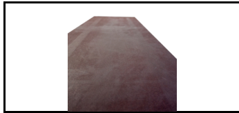
Furnier für Plattform mit Luke 7503051s