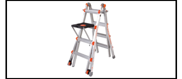
Werkzeugablage 41LG012 1607745