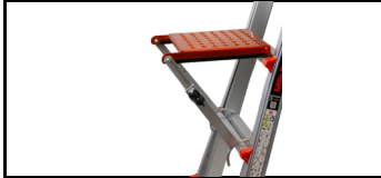
Plattform für Sicherheit 41LG104 1270701