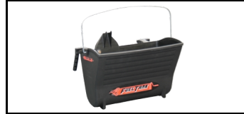
Rollenkübel 41LG050 1607744