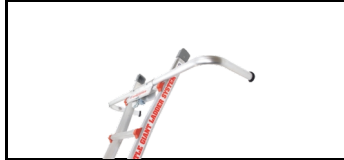
Abstandshalter 41LG111 1270699