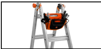
Werkzeugtasche 41LG040 1611762