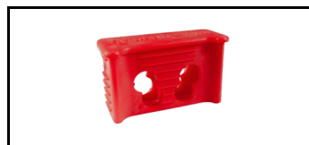
Stütze oben 41JSS912