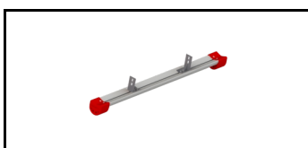
Super Pro Ladder Stand