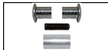
Schraube & Mutter