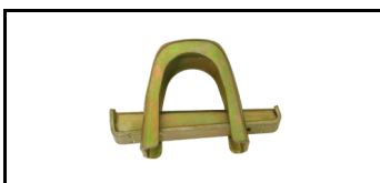
Keilkupplung 18SFS216 5189340