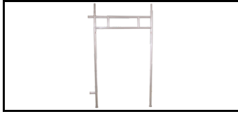
Rahmen für den Bürgersteig 12135225 5189254