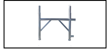
Fassadenzarge 50 cm 12079050s 1252851