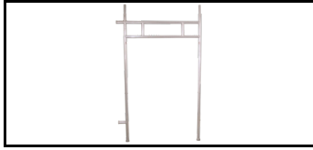
Rahmen für den Bürgersteig 12135225 5189254