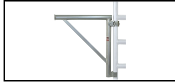
Konsole 1520060 5929687