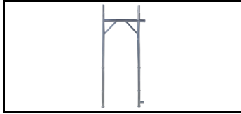
Rahmen der Fassade 2 m 12079200s 1252848