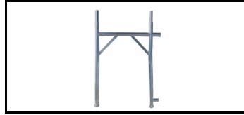
Rahmen der Fassade 1 m 12079100s 1252849