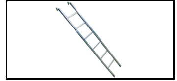
Gerüstleiter 1550212 5929691