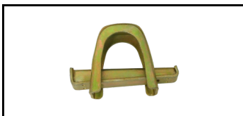
Keilkupplung 18SFS216 5189340