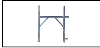
Fassade Rahmen 75 cm 12079075s 1252850