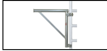
Konsole 1520060 5929687