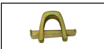
Keilkupplung 18SFS216 5189340