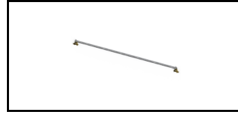
Diagonale 26GS1041 5033753