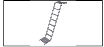
Treppe / Gerüstleiter 26GS1111 5033770