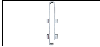
Beam Rider 26GS1033 5033765