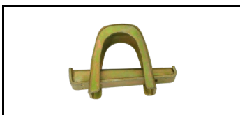
Keilkupplung 18SFS216 5189340