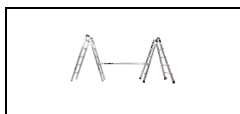
Teleskopplanke 41LG244 1270706