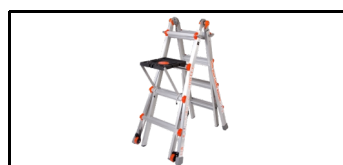
Værktøjsbakke 41LG012 1607745