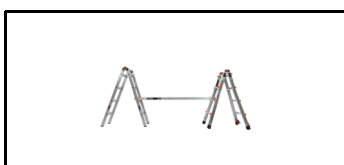
Teleskopplanke 41LG183 1270704