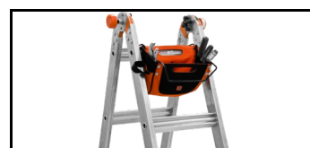
Værktøjspose 41LG040 1611762