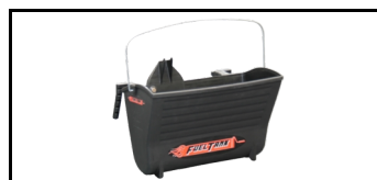
Rullespand 41LG050 1607744