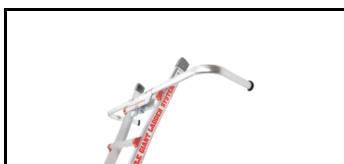
Afstandholder 41LG111 1270699