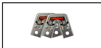
Hængsel 41LG212 1611766