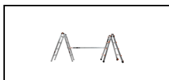
Teleskopplanke 41LG183 1270704