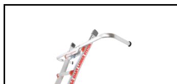
Afstandholder 41LG111 1270699