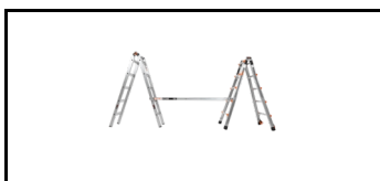
Teleskopplanke 41LG244 1270706