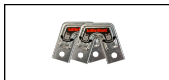
Hængsel 41LG212 1611766