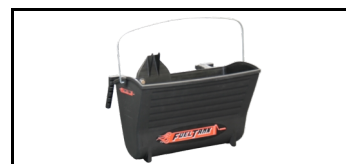
Rullespand 41LG050 1607744