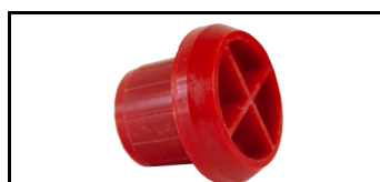
Top prop til spindel 1400211NY