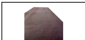
Finér til dæk u/lem 7501780