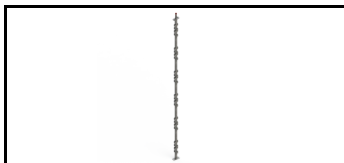
Søjle 26GS1011 5033745