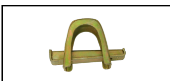
Kilekobling 18SFS216 5189340