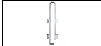
Bjælkerytter 26GS1033 5033765