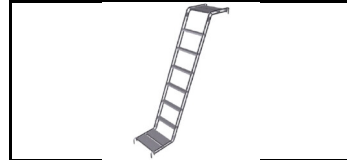
Trappe / stilladsstige 26GS1111 5033770