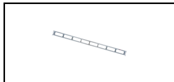
Længdebjælke - Let ec 26GS1091-L 1991012