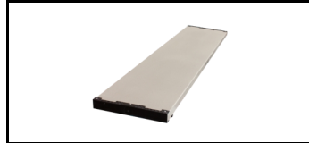
Tralle 26ST1107 1586206