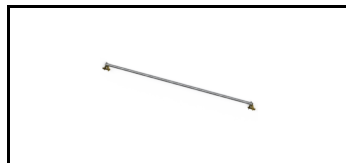
Diagonal 26GS1041 5033753