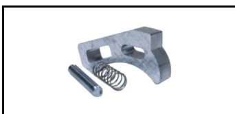
Tunge ALU 1600300