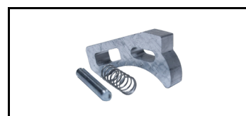
Tunge ALU 1600300