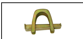
KileKobling 18SFS216 5189340