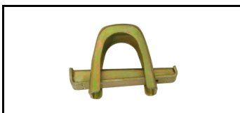
Kilekobling 18SFS216 5189340