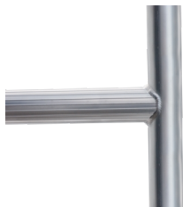
Ekstra stærke fuldsvejste samlinger. Det sikrer et stabilt og holdbart stillads.