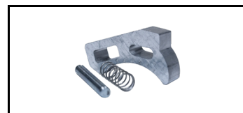
Tunge ALU 1600300