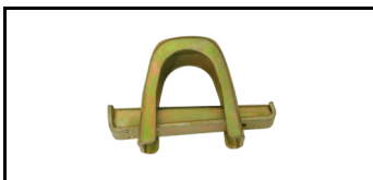
Keilkupplung 18SFS216 5189340