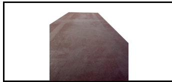
Furnier für Plattform ohne Luke 7501780