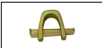
Keilkupplung 18SFS216 5189340