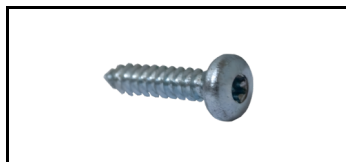
Schraube 5,5x25 skruue