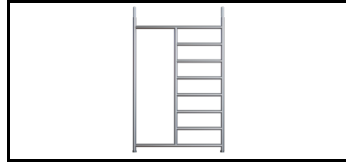
Überprüfung des Rahmens 12131200 5189252