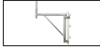
Konsole 1520060H 5929688