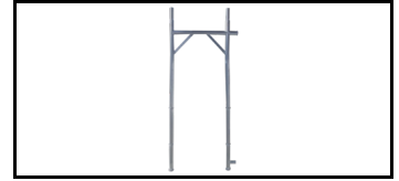
Oberer Rahmen 2 m 12079200 5929665