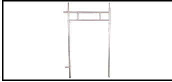
Rahmen für den Bürgersteig 12135225 5189254