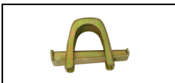
Keilkupplung 18SFS216 5189340