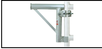
Konsole 1520030 5189257