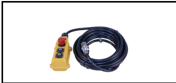
Steuergerät M.10m. Kabel 38CWS80STYR