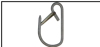
Hebehaken 38GEDA1408 1386840