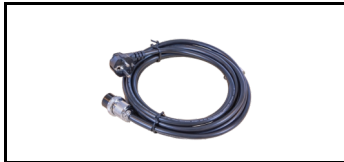
Netzkabel 5 Meter. 38CWS80EL