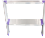
Ergonomisk designede 8 cm brede trin i aluminium