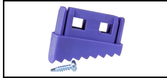
Fod (smal) 45TSE901