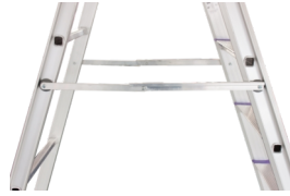
Kraftige skærehængsler - giver en robust og sikker stige.