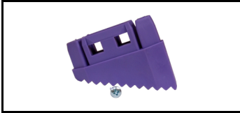
Fod (bred) 45TSE900