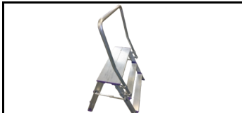
Pro Classic Gelænder 45GL355 1959815