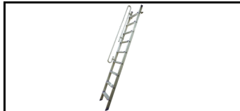
Pro Classic Gelænder 45GL1670 1959799