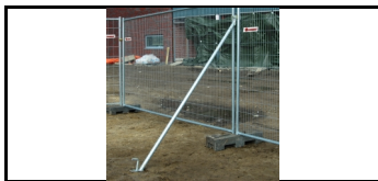
Støtteben 35BH103 1849514