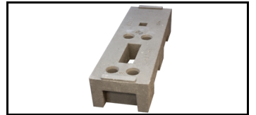
Gummiklods 35BH101 5640183