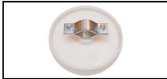
Hjul 35BH013 1528853