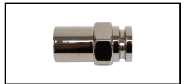
Nøgle t/Specialkobling 35BH112 1963733