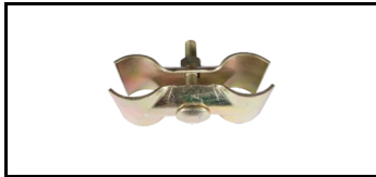
Sikkerheds Kobling 35BH102 5741579