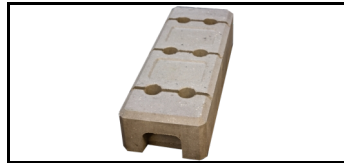
Betonklods 35BH100 5640182