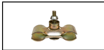
Byggehegns Specialkobling 35BH111 1963732