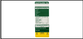
Scaftag-Schild 15SHSEN 1678720