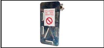
Scaftag-Halter 15SHSK 1678716