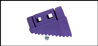
Fuß (breit) 45TSE900