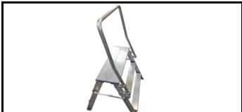
Pro Classic Handlauf 45GL540 1959848