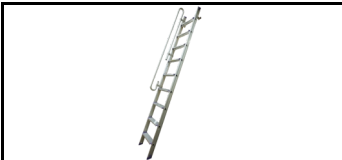
Pro Classic Handlauf 45GL1075 1959794