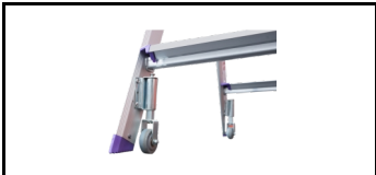
Pro Classic-Räder 45HJ100 1959809